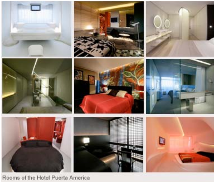
Rooms of the Hotel Puerta America

최근, 호텔에서는 다양한 패션 디자이너들을 고용함으로써 실내와 건물 디자인의 임무를 맡기고 있다. 아르마니, 랄프로렌, 그리고 베르사체와 같이 흔히 들어왔던 그들의 재능을 호텔의 실내 인테리어를 통해 다시금 만날 수 있게된다. 밑에 첨부된 사진은 스페인에 있는 호텔로 다양한 패션 디자이너들만의 개성을 마음껏 볼 수 있는 자료들이다.