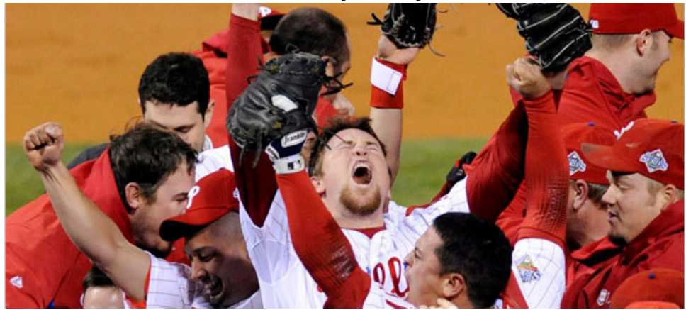
The Philadelphia Phillies win the World Series.

Lunes, Octubre 27: Serie Mundial Juego 5, que podría haber sido el punto clave para los Filis de Filadelfia, se aplaza por la lluvia. Es detenido después de 5 entradas y la puntuación vinculada 2-2. El reinicio del juego se ha programado para el día siguiente.